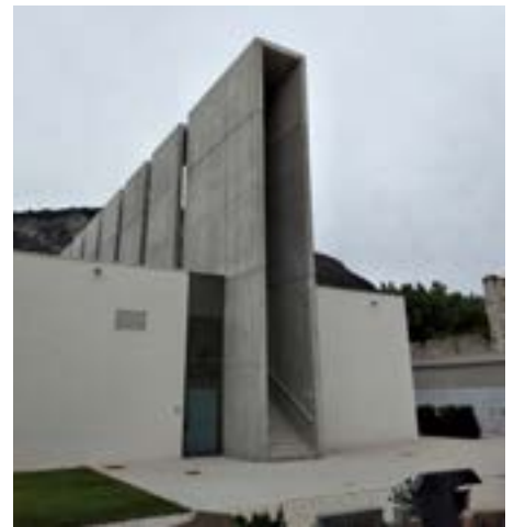
L'ingresso ai piani superiori del Tempio Crematorio

alla So.Crem, escluse la gestione del funerale e le spese per la cremazione che rimangano sempre a carico dei famigliari. Per molti di voi, cari lettori, questi sono concetti noti, però è bene ricordarli perché voi li possiate trasmettere ai vostri conoscenti, che non hanno ancora la fortuna di essersi iscritti alla So.Crem., fate loro conoscere i vantaggi che offre la nostra Associazione, il cui impegno è quello di diffondere la cultura della cremazione. Se ognuno di noi riuscisse a portare un nuovo socio, la nostra Associazione aumenterebbe la sua forza per affrontare i prossimi appuntamenti che ancora ci aspettano: già ci siamo contraddistinti nella battaglia affinché Trento potesse disporre di un Tempio crematorio. Ci sono voluti tanti anni, ma alla fine il buon senso è prevalso su