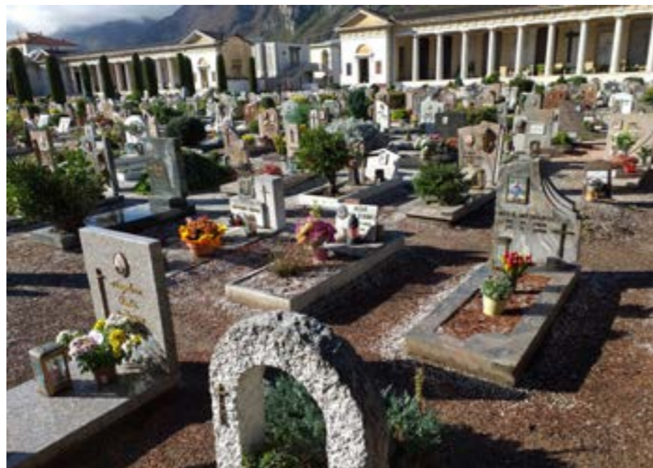
I primi giorni di novembre sono sempre stati dedicati al ricordo dei cari defunti: sono giorni carichi di commozione che contraddistinguono questo periodo dell'anno.

LA SO.CREM. ORA DISPONE DELLA PARTITA IVA N° 02769150224